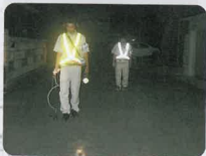
路面音聴調査状況【夜間】