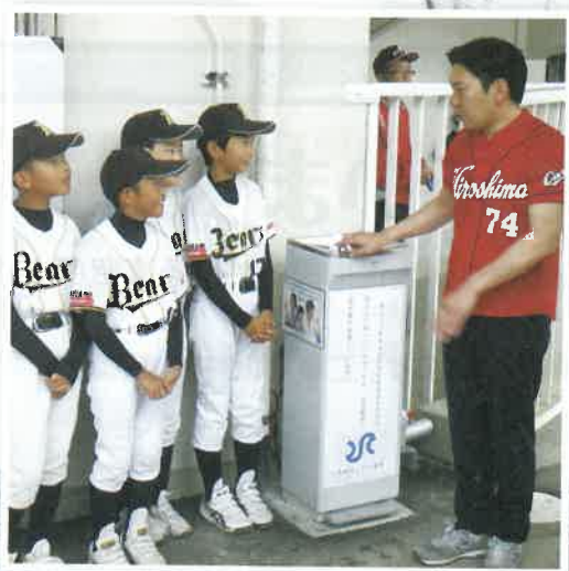
野球場・テニスコートに冷水器を設置しました。