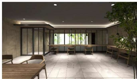
コワーキングスペース