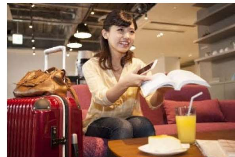
カフェで待ち時間を過ごす