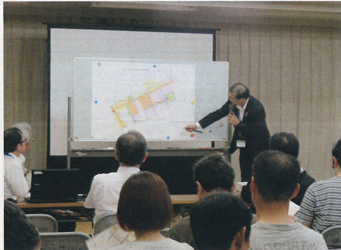
権利者説明会のようす