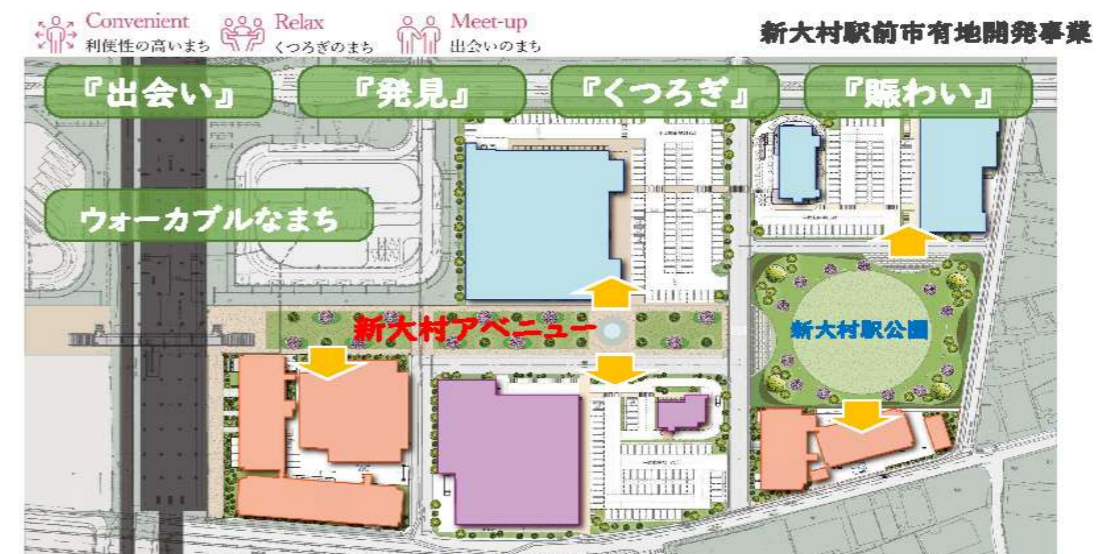
【事業予定者の提案内容より】

事業予定者の提案では、新大村駅前の通り(アベニュー)を中心に、人々が集い、行き交うまちづくりを目指して、市民と来訪者の双方にとって魅力ある都市拠点創造する開発の方向性となっております。令和5年3月までに市と事業予定者3社との土地売買契約を予定しており、その後2年間程度を目途に、段階的に施設が完成する見込みとなっております。