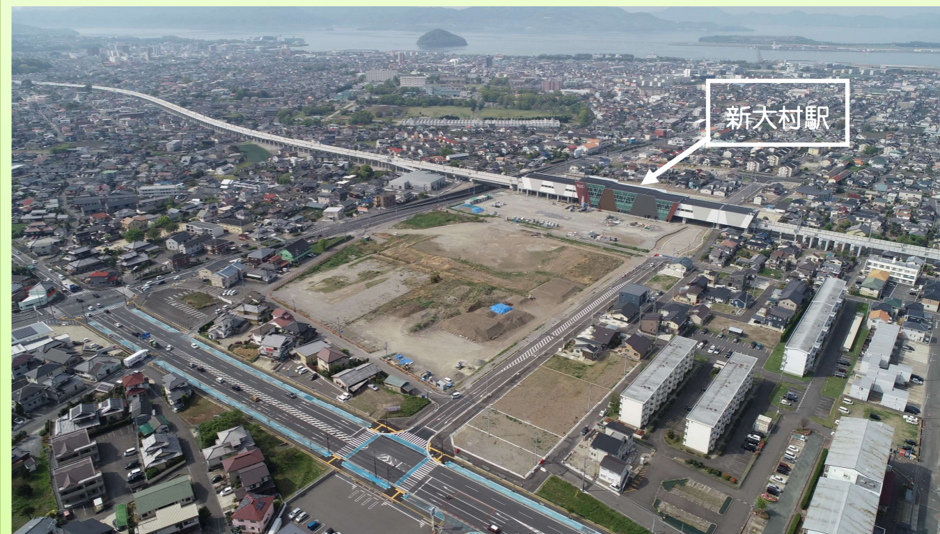
令和3年4月頃のドローン写真

今後も、工事の安全などに十分配慮しながら、職員一同、早期の事業完了に向けて、事業の推進に努めてまいりますので、皆様の御理解と御協力をお願いいたします。