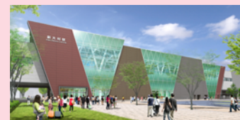
新大村駅(仮称)イメージ

新幹線の開業効果を最大限に発揮させるために、具体的な取組をまとめたものです。アクションプランの取組事業は、「オール大村」で推進することとしており、行政だけでなく、民間企業や市民などの多様な団体が連携・一致団結して進めていきます。