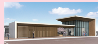
車両基地駅(仮称)イメージ

https://www.city.omura.nagasaki.jp/shinkansen/kurashi/kotsu/shinkansen/actionplan.html