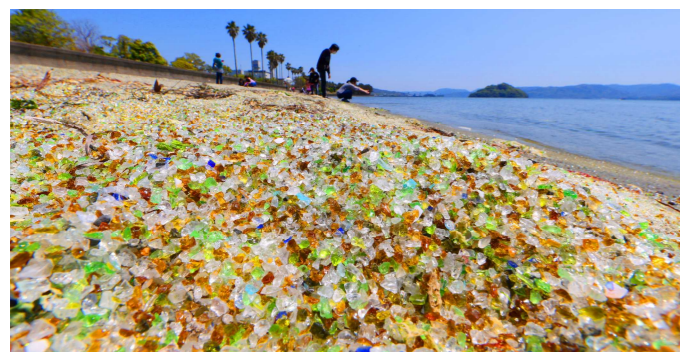
ガラスの砂浜(森園公園)