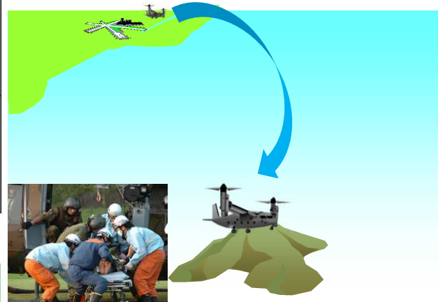
飛行場のない離島でも離着陸可能