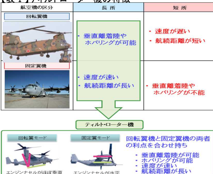
【表I】ティルトローター機の特徴