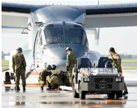
機体の到着、受入点検(令和2年7月上旬～)