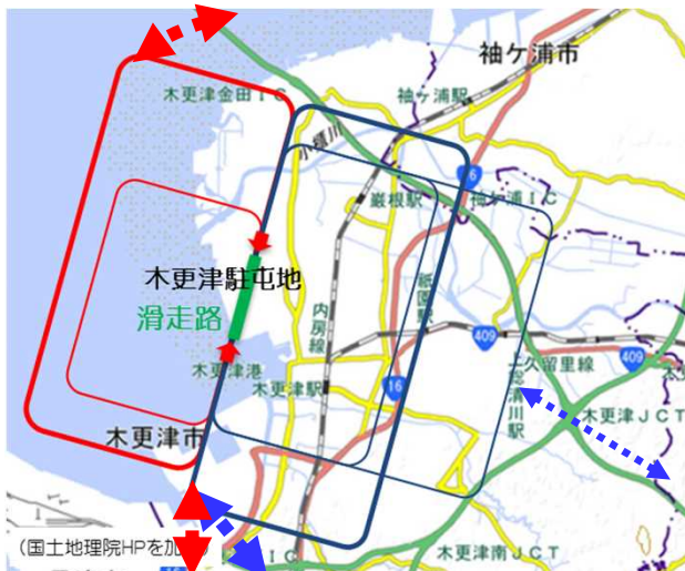
場周経路（イメージ）