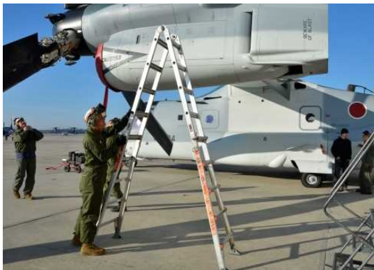
機体の点検・整備