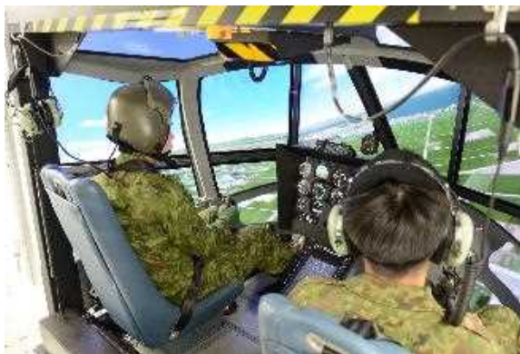
教育訓練による人材育成