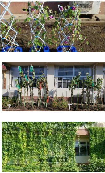
① ② ③

8月27日(金)、登校時の健康観察の後、運動場や、外庭の環境点検をかねて歩いてみました。次の画像はその際に撮ったものです。