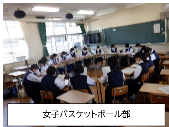
女子バスケットボール部