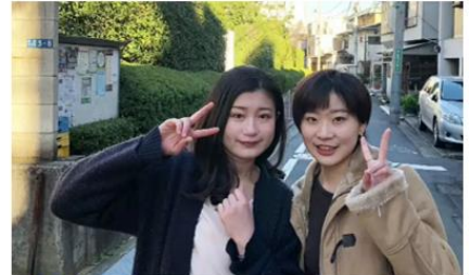
3 久々の再会 めっちゃ遊んだ！