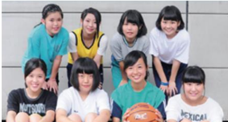
1 バスケ楽しかった！

<あなたは、これらの写真をネットに公開しますか？公開した時のリスクについて考えていきましょう。>