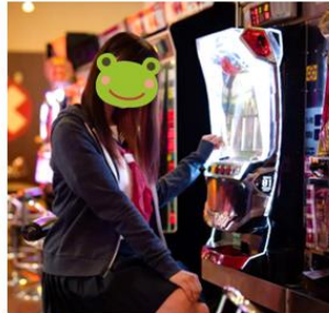
2 学校休んでゲーセン