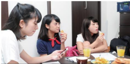
4 ミナの家で勉強会ww