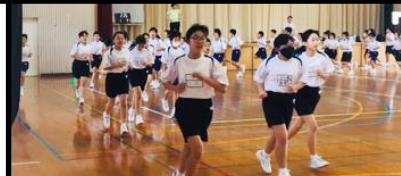
保健体育時の5分間走 感染予防に努めながらも、体育時のマスク着用が大幅に緩和されました。

〇コンクールがすべてなくなったことで、私の中学校での吹奏楽生活が終わってしまったと錯覚するのはあまりにもつまらないので、私は、これから先にすべてをかけます。だって、私たちは定演が無事成功するその瞬間まで、大中プラスの3年生であり、大切なこの思いを後輩に伝える使命があるからです…。