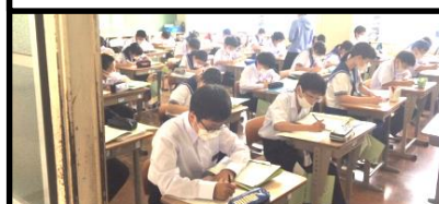
授業中の真剣な眼差しが 戻ってきました。