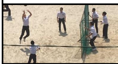
3年生男子恒例 昼休みの運動場 バレーボール大会??です!