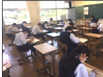
3年生は各クラスとも2クラスに分かれての5教科実力テストでした。

臨時休業期間の課題提出や3年生にはいきなりの実力テストに苦勞した生徒もたくさんいたと思いますが、今日から始まった学校再開の中で、また自分の夢や希望の実現に向けて、一歩、一歩確実に歩んでいってほしいと思っています。そして、そんなみなさんを大村中学校は応援していきます。頑張れ~!