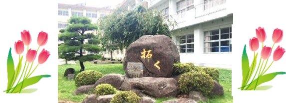
開校の精神「拓く」の記念碑

第1学年 6学級 第2学年 5学級 第3学年 5学級 特別支援学級(知・情) 2学級 合計18学級 全校生徒551名 18学級でスタートします！