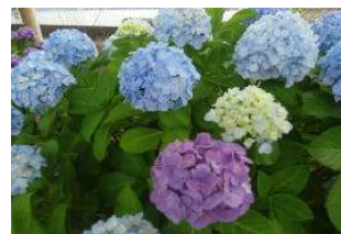
敷地内のアジサイ