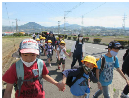
〈6年生は1年生と手をつないで〉