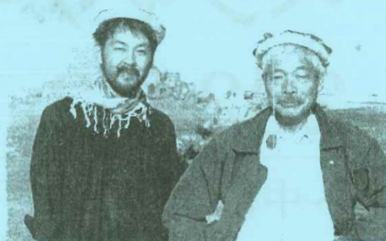
中村哲医師と中原興平氏=2014年11月

アフガニスタンで用水路の建設に長年取り組む中村哲医師を訪ね、現地滞在し取材を行い、帰国後特集を連載。その後も密着した取材と交流を続ける。2019年中村医師が銃弾に倒れた後に、西日本新聞社のホームページに中村医師の功績を纏めた特設ページを開設し、継続的なペシャワール会やPMSの支援に繋げる。