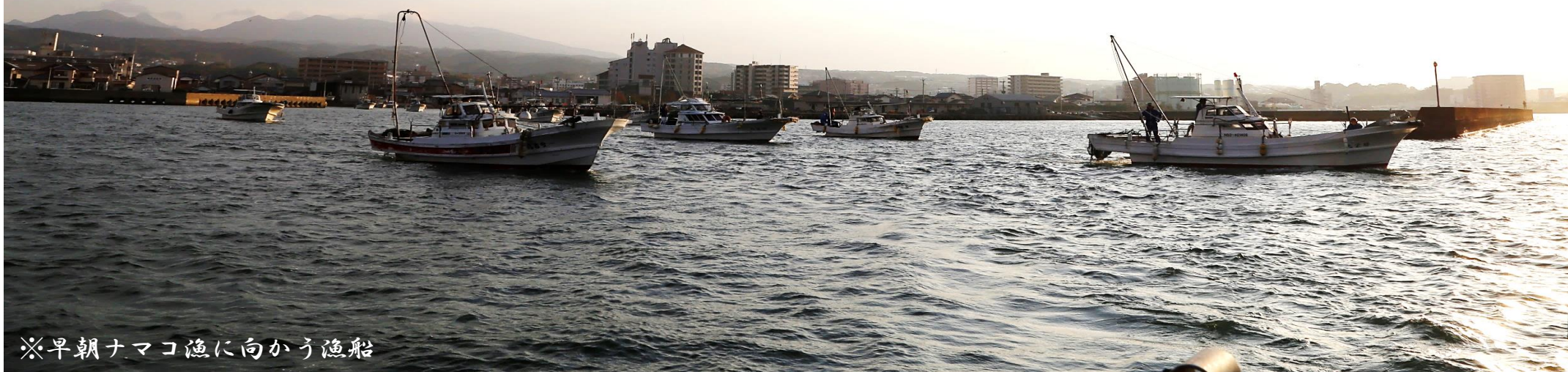
※早朝ナマコ漁に向かう漁船