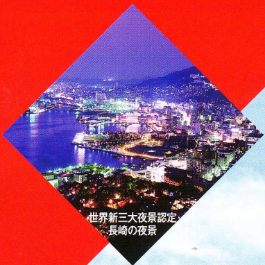
世界新三大夜景認定 長崎の夜景