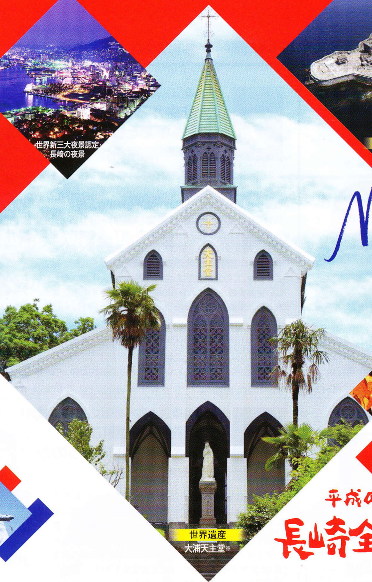
世界遺産 大浦天主堂*