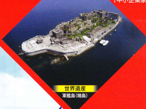
世界遺産 軍艦島(端島)