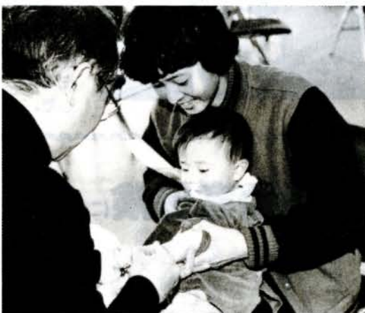
(注射、こわくなんかないよ)