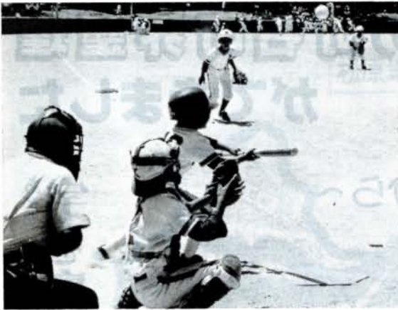
小学生・池田新町、中学生・向陽寮が優勝 (8/2~3、市営野球場ほか)

スポーツ少年団ソフトボール大会に小学生55チーム、中学生45チームが参加、熱戦が展開されました。(小学生の部)①池田新町②上諏訪③鬼橋、小路口若桜 (中学生の部)①向陽寮②上久原③池田新町、新城