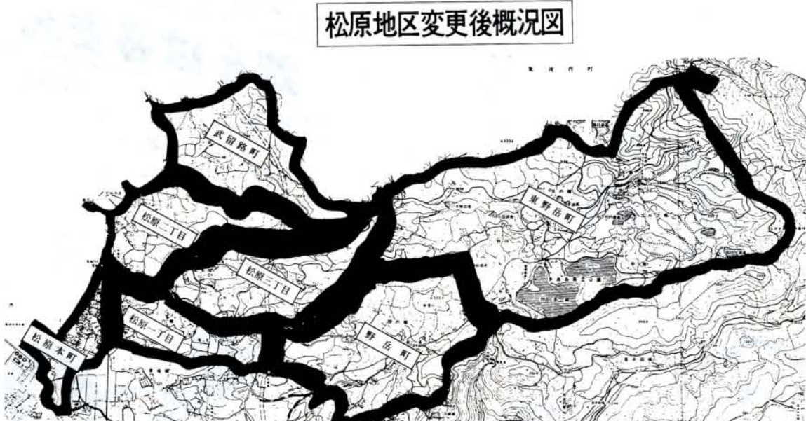
松原地区変更後概況図