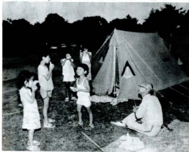
ファミリーキャンプ大会 (7/19、野岳湖)

このような意欲的に遊べる幼児を育てることだと思えます。 ややもすると 昨今、知的教育のみに目がむけられがちですが十分遊ばせることによって、幼児なりに考える力、知らないことにも対処していく力などがついていくのではないのでしょうか。 当園でも、従来の教師の意図を先行させた一斉保育に反省を