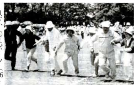
それ行け(老人スポーツ大会より)

人間が生きていくうえで何が大切かを考えてください。答えは「心の張り」でしょう。お年寄りに気をつかい何もしてもらわないというのでは、敬うというより「心の張り」を奪ってしまうことになるのではないのでしょうか。