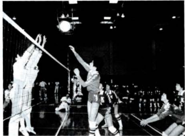
国道444号の早期開通を目指して(8/6、市民体育館) 大村・鹿島両市から小・中学生・婦人の各2チームが参加し、親善バレーボール大会が開かれました。

一緒に歩いて親子のふれ合いを——と、竹松地区の第3回深夜親子歩こう会が開かれ、幼稚園児から大人まで約180人が参加、全員が見事、20キロを歩きました。