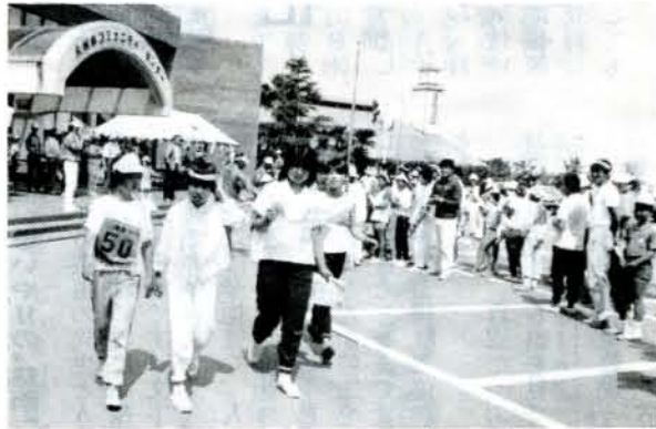
(今年、5月に開催されたウォークラリー大会より)

ファミリーキャンプ大会の指導などに活躍。特に、夏休み中はキャンプの指導などに大活躍の会員もいます。また、軽スポーツ「インディアカ」の普及にも努力中です。 大村レクの発足と前後して結成された、長崎県レクリエーション協会も今年で10周年を迎え、9月7日、長崎市で県レクリエーション大会を開催するなど、レクの普及に一步一步努力しています。 レクについてのお尋ねは、お気軽に、大村レクリエーション愛好会(市コミセン内)へどうぞ。(岸川 勇男)