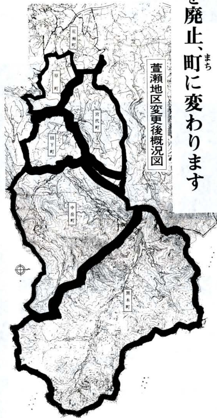
萱瀬地区変更後概況図

大村市には、町の名称が公称の字名と通称の町名があり、皆さんの日常生活や、市の行政を進めるのに大変不便なのが実態です。 そこで、町名を一本化し、同時に町の区域を実情に合わせるため、町名町界の整理を進めていきますが、今回、松原・萱瀬地区の町名町界を、9月8日から変更することになりました。