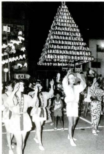
▲最後は、みんな「おおむら音頭総踊り」