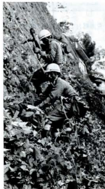
玖島城、スツキリ(8/6、大村公園) 九州電工大村営業所の皆さんが、玖島城の石垣に生い茂った雑草を清掃奉仕。約1時間の作業で石垣は見違えるほどになりました。

大村商工会議所創立40周年記念事業の一環として「NTTオレンジ野球教室」が開かれました。小・中学生約160人が参加し、熱心に指導を受けていました。