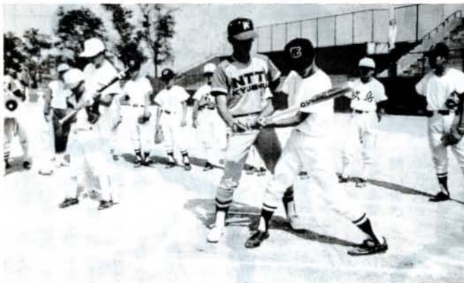
野球少年、熱心に受講(8/6、市営野球場)

大村商工会議所創立40周年記念事業の一環として「NTTオレンジ野球教室」が開かれました。小・中学生約160人が参加し、熱心に指導を受けていました。