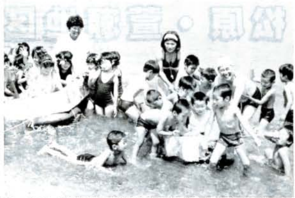
やったね、僕らの船が浮かんだよ(8/6、松原海水浴場) 松原幼稚園の園児33人が、牛乳パックで船作りに挑戦。154/パックと200/パックを使い2隻を作り上げ、早速、近くの海水浴場で船を浮かべ大歓声をあげていました。

スポーツ少年団ソフトボール大会に小学生55チーム、中学生45チームが参加、熱戦が展開されました。(小学生の部)①池田新町②上諏訪③鬼橋、小路口若桜 (中学生の部)①向陽寮②上久原③池田新町、新城