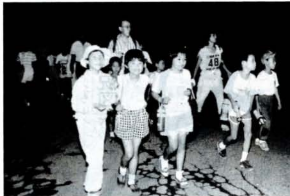
皆んなで歩いたよ、20キロ(8/6、竹松~野岳湖)

一緒に歩いて親子のふれ合いを——と、竹松地区の第3回深夜親子歩こう会が開かれ、幼稚園児から大人まで約180人が参加、全員が見事、20キロを歩きました。