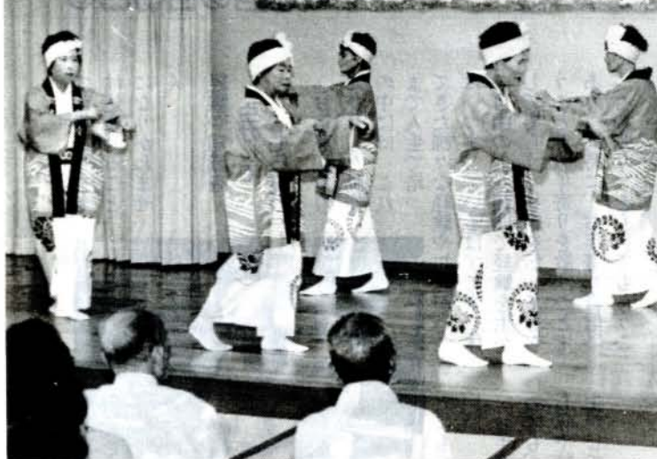
(昨年の敬老の日記念演芸大会より)