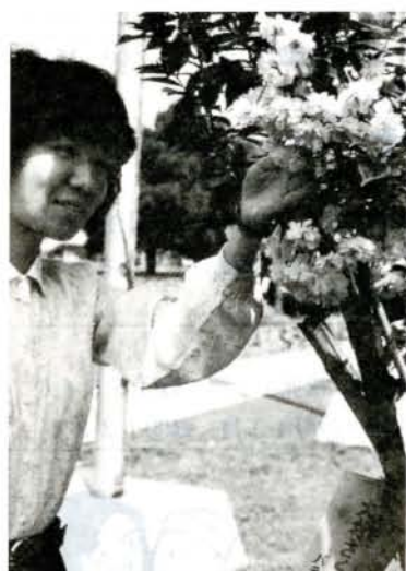
(伊丹市で咲いたオオムラザクラ)

姉妹都市伊丹市の市庁舎庭に、オオムラザクラが見事な花を咲かせました。この桜は、姉妹都市の提携記念として、伊丹