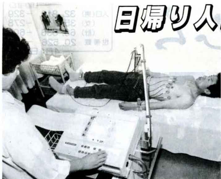
(心電図検査の様子)

健康に自信ありますか——。病気は、予防はもちろん、早期発見・早期治療が大切です。市立病院では、日帰り人間ドックを開設しました。これは、従来2泊3日コースの人間ドックを実施していましたが、2泊3日だと時間がとれない人が多いため、今回、新たに開設したものです。お気軽に受診してください。 コースは、A～Dコースまで4コースあります。各コース選択制ですが、特に40歳以上の人は、C・Dコースを受けられるようお勧めします。 なお、定期健康診断、一般健康診断および2泊3日の人間ドックも従来どおり行っていますので、ご利用ください。 受診の申し込みなど、詳しいことは、市立病院医事係へお尋ねください。