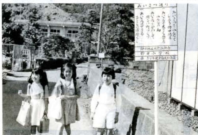
(あいさつ通りを元気に通う子供たち)

国鉄大村線と国道34号線が平行して縦断し、高速自動車道も横断する農業を中心とした鈴田小学校区健全協は、設立されてから4年を過ぎようとしており、子ども会育成会・PTAが中心になり、町内会・婦人会・青年団・公民館・防犯組合など諸団体に協力呼びかけ、それぞれの役員