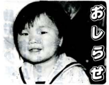
(手操り 里美ちゃん・原口町)