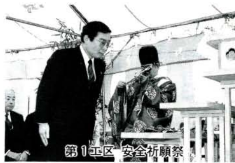
第1工区 安全祈願祭

地です。同団地は、先端技術産業の立地を図り、ひいては健全な工業の発展により、今後の市の活性化が期待されます。