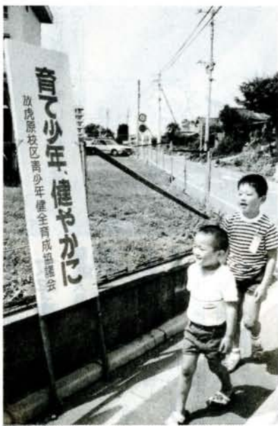
健全育成を呼びかける立看板

また、広報紙「ほうこ」を全家庭に配布するなど、「非行防止の第一歩は、青少年を理解することから」と、いろいろな面で努力し、前進している健全協です。