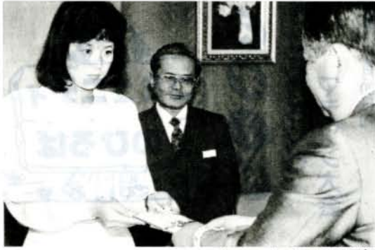
(ツツジの目録贈呈)