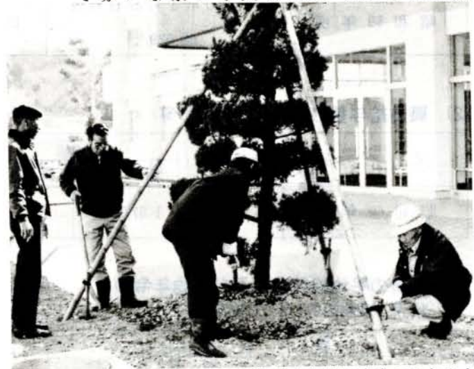
植樹奉仕に汗を流す赤佐古町内会のみなさん