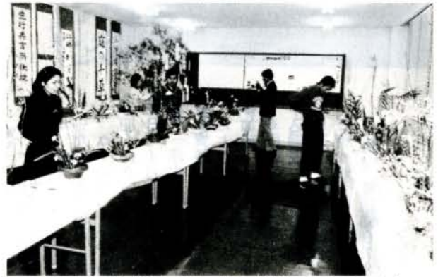
▲日頃の成果を被露(3/1~3/2 勤労青少年ホーム)

各子ども会の指導者ら 200人が参加。今年は、松並二丁目・西大村本町第二・須田ノ木の各子ども会が活動状況などを発表しました。