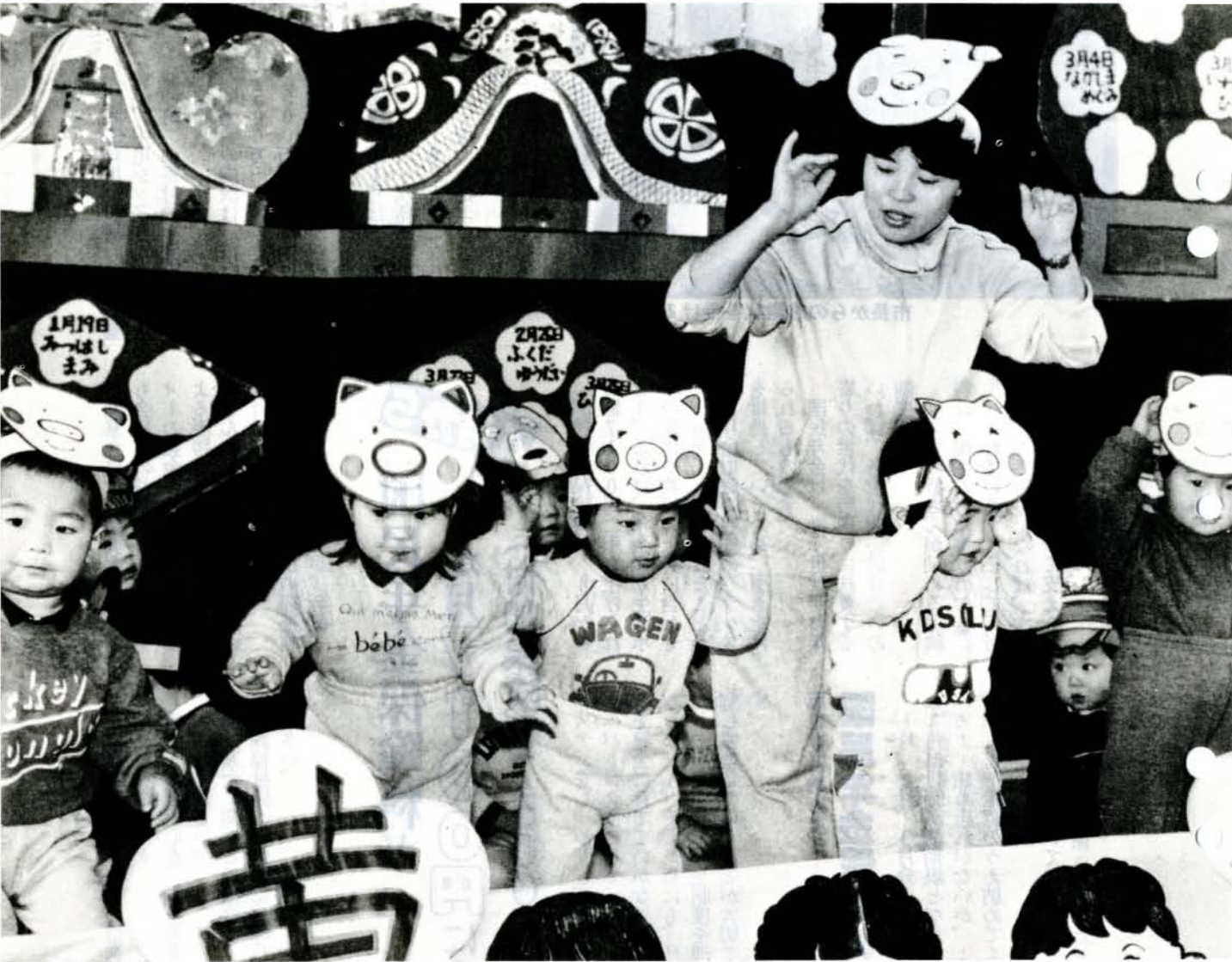
ひな祭りお誕生会 (3月3日・ふるまち保育園)