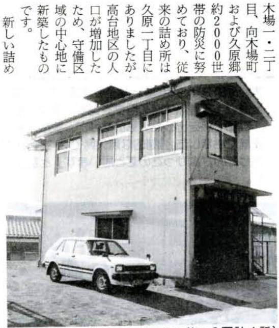
(新築の第1分団詰め所)

大村市消防団第一分団の新しい詰め所が、久原二丁目に総事業費約2100万円をかけて、完成しました。