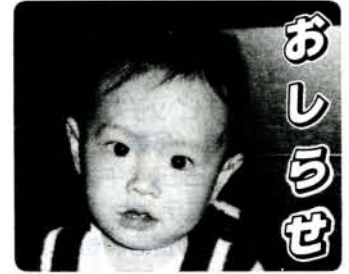
（木村康臣くん・西大村本町） きむらやひろみ