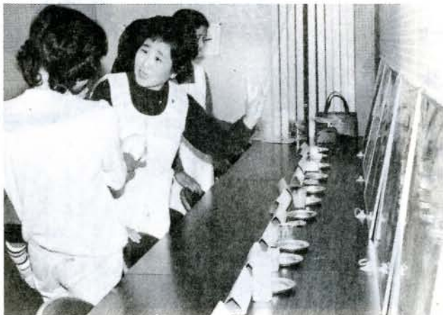
おやつを考えるコーナー(1歳6か月健診会場で)

員さんは「健診のお勧めに何 度も足を運んだ後、受診して 良かったと言われたと、ああ 勧めに行つて良かったなとつ くづく思います。地域の隅々 まで出かけるので、大変な時 もありますけど、大切な役目 として頑張っていきたいです ね」と話し、今日も地図を片 手に活躍しています。