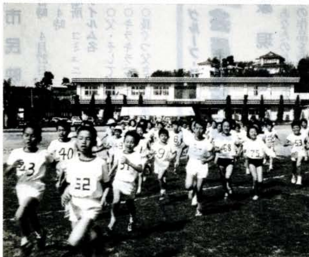
(3/31、地区マラソン・駅伝大会)

青少年の非行防止と健全育成は、地域ぐるみで取り組んでいかなければ、効果をあげることは難しいものです。今回から、この問題に取り組んでいる各地区の青少年健全育成協議会の活動を紹介します。 静かな農村地帯の福重小学校健全協では、青少年の実態の把握と対策を協議するため、 部 青少年健全育成委員会、部 公民館、町内会長会や派出所などと緊密な連携のものと情報交換、事例研究などを行っています。 組織としては、運営委員会を中心に健全育成活動部、非行事故防止部、社会環境浄化部、広報啓発部があります。 主な活動は、休暇前の部落PTAとの懇談や地区公民館