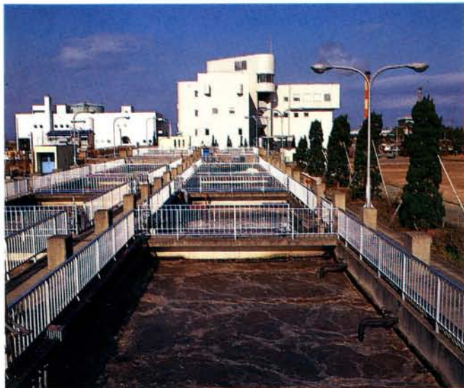
浄水管理センター（松山町）