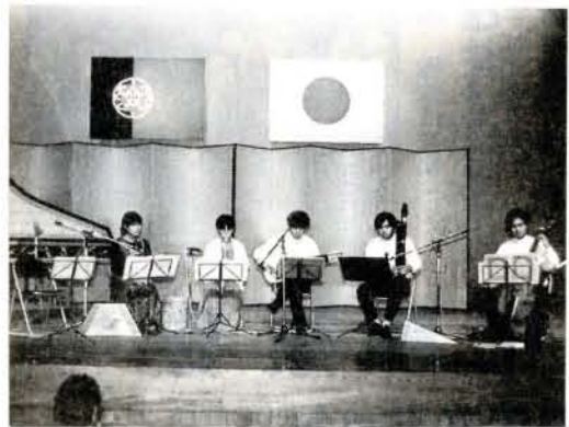
天正少年使節復元音楽演奏 (5/29・市民会館)