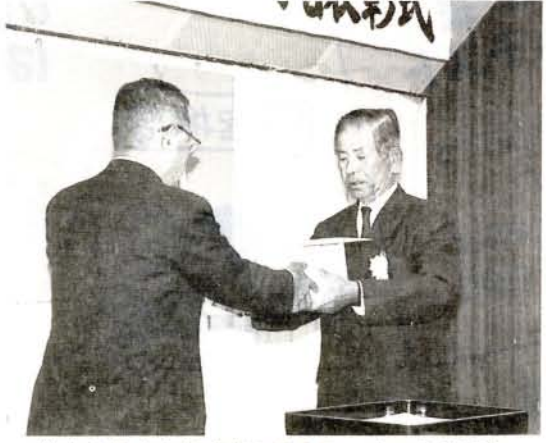
教育功労者表彰式(11月1日・商工会議所)

本市の教育・文化の振興に寄与された方、および団体、並びに永年にわたり児童生徒の教育に専念された方などの表彰式が11月1日、行われました。 表彰を受けられた方々は、次のとおりです。(敬称略)