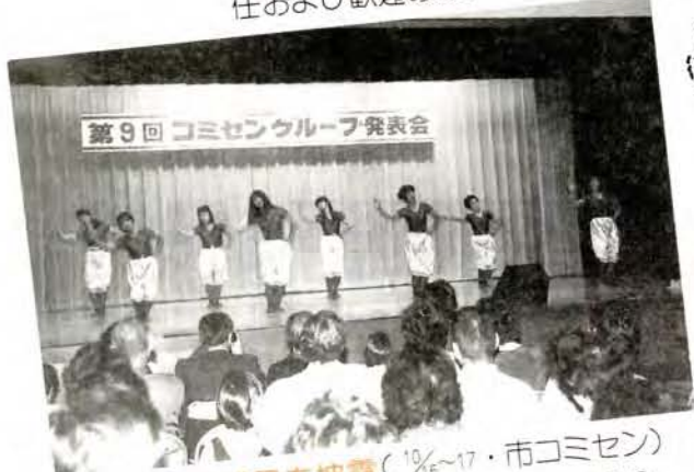
▲ 1年間の成果を披露 (1/5~17・市コミセン) 市コミセンを利用する60団体、会員約1000人が、10月15日から3日間行ったコミセングループ発表会。 発表会では、陶芸、書などの展示の部と舞踊や演奏などの舞台発表の部が行われました。中には、長崎旅博をテーマにした3B体操なども発表されていました。