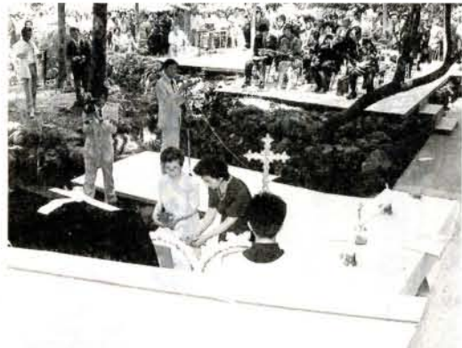
慰霊祭 (5/29・坂口館跡)