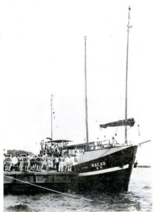
ポルトガル海軍練習帆船マカオ号 (8/2・3・市役所横埋め立て地)

中心にした書籍を発刊する計画で、現在、作業を進めています。写真は、広く一般公募していますので、ふるってご参加ください(詳しい問い合わせは、市役所内の事務局 ☎4111(内)219まで)