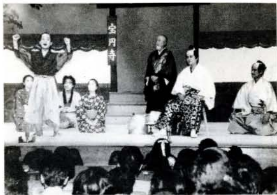
1年間の練習を披露する「勘作座」 (10月15日・市民会館)

この勘作ものがたりをテーマにして、昨年10月に結成された「勘作座」。今回の旗揚げ公演は、勘作の少年期の物語りで、とんちと方言まるだしの熱演に、親子づれなど約1000人の観客を笑いと感動のうずにくぎ付けにしました。