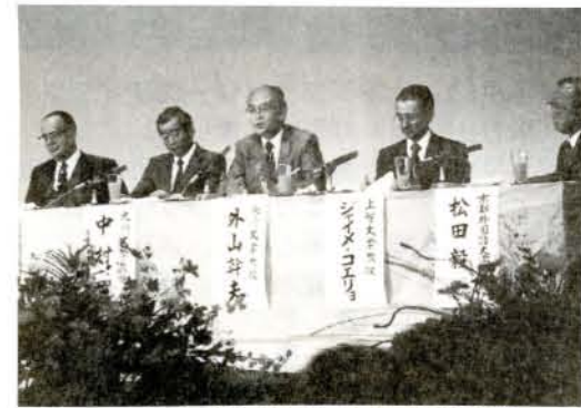
5人のパネリストの意見が激突