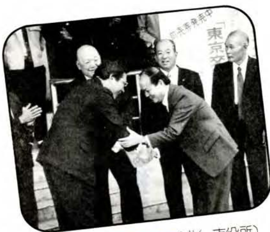
▲ ようこそ顔総領事 (1/5・市役所) 10月31日着任した、中国駐長崎総領事の顔萬榮さんが、11月15日、市役所を表敬訪問。市長、議長、商工会議所会頭、農協長、市職員などが出迎えました。 顔総領事と松本市市長は、経済・文化面など、「共に手を取り合って頑張りましょう」と、着任および歓迎のあいさつをかわしました。