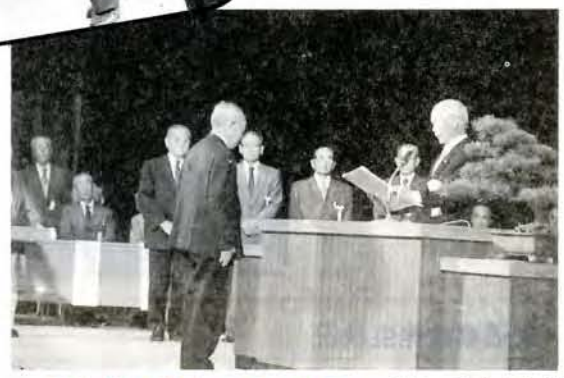
▲ 新時代に生きる老人パワー (1/8・市民会館) 第22回大村市老人福祉大会が、11月8日、市民会館で開かれました。 会場には約1100人が参加。功労役員の表彰や体験発表、講演、レクリエーションなどが行われました。 また、新たな時代に生きる老人クラブづくりや健康増進運動など6項目を決議しました。