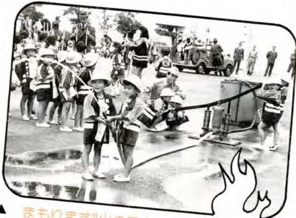
▲ まもりまず"火の用心" (1/24・県消防学校) 市内19保育所(園)から、約460人が参加して行われた、ちびっ子防火大会。 三二消防車に乗ったり、大声コーナー、手押しポンプや竹馬などのチャレンジコーナーなどで、遊びをとおして、防火の知識を高めました。

どんな仕事もOK (1/2・本町アーケード) シルバー人材センターでは22日、普及啓発のため街頭キャンペーンを行いました。 同センターは、今年4月発足。現在、会員は2500人、働き盛りまで、何者の集まりです。 草刈りから子守、障子張りまで、何でもござれと、同センターへの入会と利用を呼びかけています。