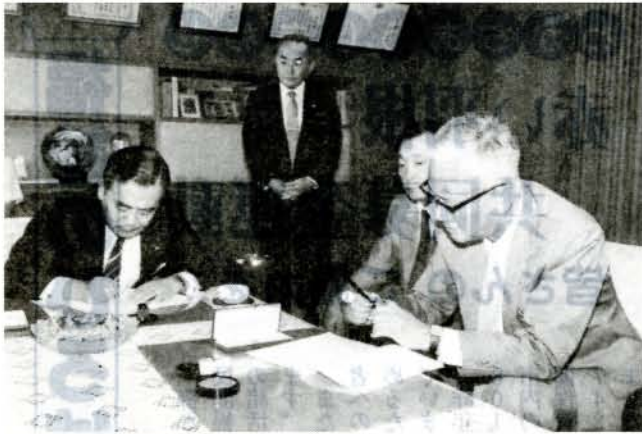
公害防止協定調印式(%) 市役所)

小松電子金属長崎工業(雄が原町)との間に、公害防止協定を締結。協定は、大気汚染、水質汚濁の防止対策はもちろん、化学物質の安全管理や自然保護まで盛り込んだ、全国的にも厳しい内容で、現時点では万全の公害防止協定です。