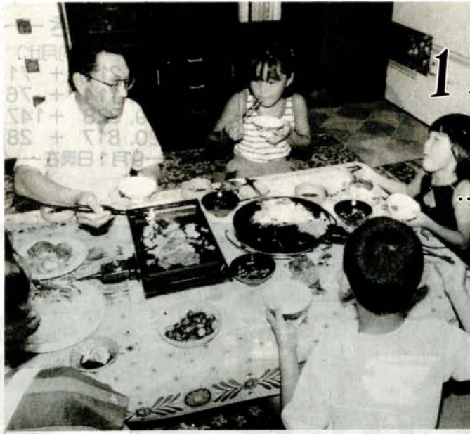
～食卓を親子のふれあいの場に～