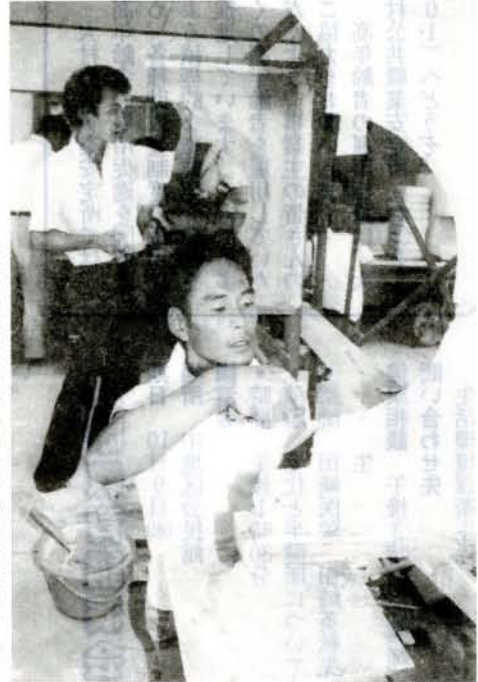
自慢の腕前を競う(%) 大村建設技術専門学校)

第19回県左官技能競技大会が開かれ、県内各地から腕自慢の職人さんが出場し、実技や学科試験に取り組みました。