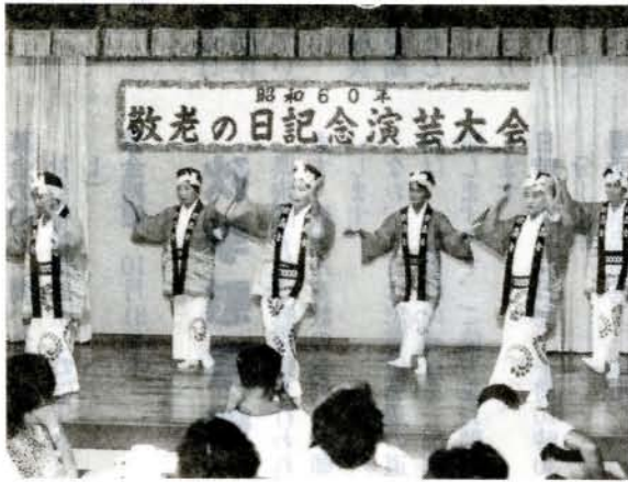
得意の芸を披露(%) 老人福祉センター) 恒例の「敬老の日記念行事、さくら庄老人演芸大会」が開かれ、歌や踊りに楽しい一日を過ごしました。

第19回県左官技能競技大会が開かれ、県内各地から腕自慢の職人さんが出場し、実技や学科試験に取り組みました。