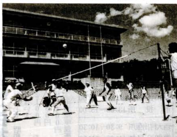
(地区対抗バレーボール大会)

開かれた「子ども水泳大会」「地区対抗バレーボール大会」は、親も子も熱中し、楽しい一日を過ごしました。それに、年ごとに中学生の参加も増えていきます。