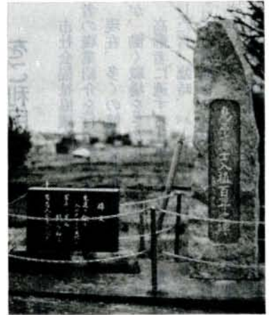
先祖の苦闘をしのんで記念碑を 建立（%、古賀島町集会所前） 旧島原藩士が大村市森園郷（現、 古賀島町）に入植してから100年 目を迎え、子孫の人たちが記念 式典を行いました。