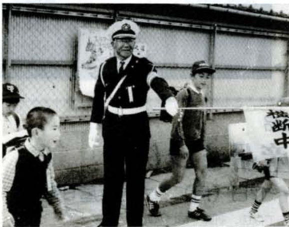
今日も、登校する子供たちを指導—西小前で—

皆さん、交通指導員制度をご存知ですか。 児童や一般歩行者を交通事故から守り、交通道徳の高揚を願って、昭和44年に発足したものです。 現在、26人の人が市長から委嘱を受け活躍しています。定例の指導日は、毎月0のつく日と、交通安全運動の期間中ですが、この外、おおむら祭や夏越まつりなど、いろいろな行事のたびに、交通指導員にいたり、その日数は、年間100日余りにも及び、中には、17年間という長い間、交通指導員を続けている人もおり、僅かな報酬で、雨の日や雪の日など、朝早 くからボランティア精神で、交通指導員を行っています。 ある指導員さんは、「毎日何よりも嬉しいのは、子供たちの元気なあいさつや、皆さんの励ましですね。残念なのは信号を無視する人がいることです。子は親を見て育つといえます。まず、大人が手本を示して欲しいですね」と話していらっしゃいます。