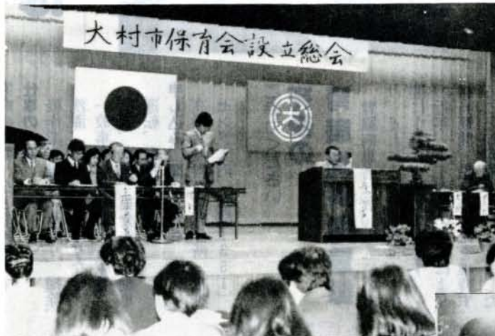
大村市保育会が設立（%、コミュニティセンター）

乳幼児保育にたずさわる、公立保育所5か所、私立 保育園16園が、よりよい保育の在り方を探ろうと、 大村市保育会を設立。コミュニティセンターで保母 さんら 230人が出席して設立総会が開かれました。