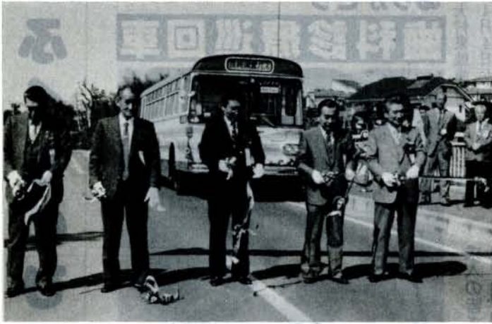
赤佐古線開通式（%、田の平橋バス停）

県営バスの赤佐古線が開通し、田の平橋バス停で地元の人たちが参加して、開通式が行われました。