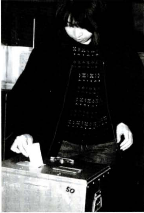
あすの道 決める私のこの一票