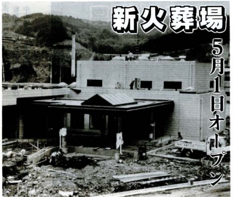
完成間近の新火葬場（3月13日撮影）

今までの火葬場は、昭和19年から現在地で火葬を行ってきましたが、その間、豪雨による浸水あるいは薪炭炉から重油炉へ変換するなどして、43年を経過しました。 また、立替えてから、すでに25年になり老朽化が著しく、炉の性能も悪く、待合機能の不備などのため利用者の皆さんに大変不便をかけてきました。 祖先を尊びその霊を祭ることは、人間本来の姿であり永劫不