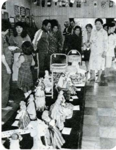
町内の文化の発展を願って (11/6~8 古賀島町集会所) 地域文化の発展を目指して6年前から実施されている古賀島町の展示会。今年も幼稚園児から80歳までの約170人が出品。連日会場を訪れる人でにぎわっていました。