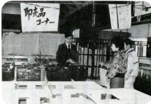
苦心の作品を披露、ろう学校文化祭 (11/20~21 県立ろう学校) 文化祭は2年に1回開かれており、木工家具や洋裁、和裁の作品展示や、劇、遊戯など日頃の成果が発表されました。