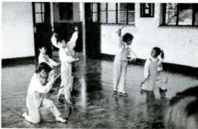
新村の託児所の子供たち

曾陽新村は、一九五一年に上海で最も早くできた団地で、面積は二百万平方メートルあり、昔は荒地と墓