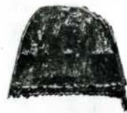
右・発掘された堅櫛 左・堅櫛復元図