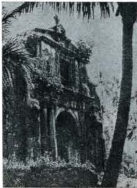
少年達が滞在了ゴアのサン・パウロ学院教会