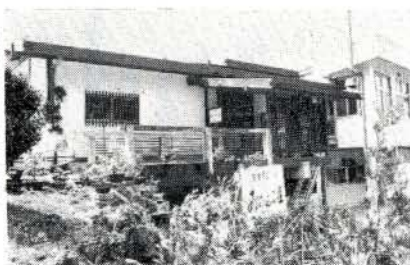
小浜おおむら荘全景

市民の厚生施設として親しまれています。小浜おおむら荘は、四月一日から、大村市社会福祉協議会に委託して運営することになりました。