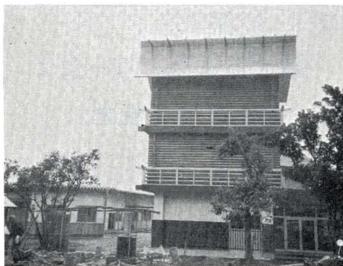
校舎造り（正面）の施設外