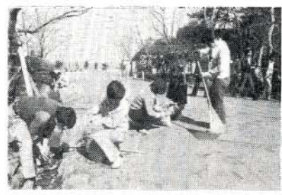
三月二十日（日）大村公園で、市内に勤務する青年男女五十四人が参加して植樹と清掃奉仕（写真左）を実施しました。

清掃は、史跡を勉強するための一環として当地にある日月の池を中心に、市内の労働組合団体の組合員が雨の中を草刈りなどで汗を流した後、史跡の説明を受けました。