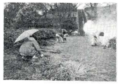
三月十三日（日）上小路旗志堂で、史跡の清掃奉仕（写真右）を実施しました。

清掃は、史跡を勉強するための一環として当地にある日月の池を中心に、市内の労働組合団体の組合員が雨の中を草刈りなどで汗を流した後、史跡の説明を受けました。