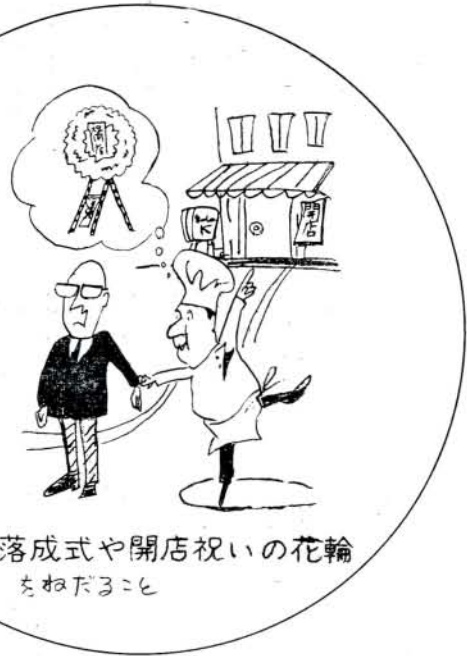
落成式や開店祝いの花輪 をねだること