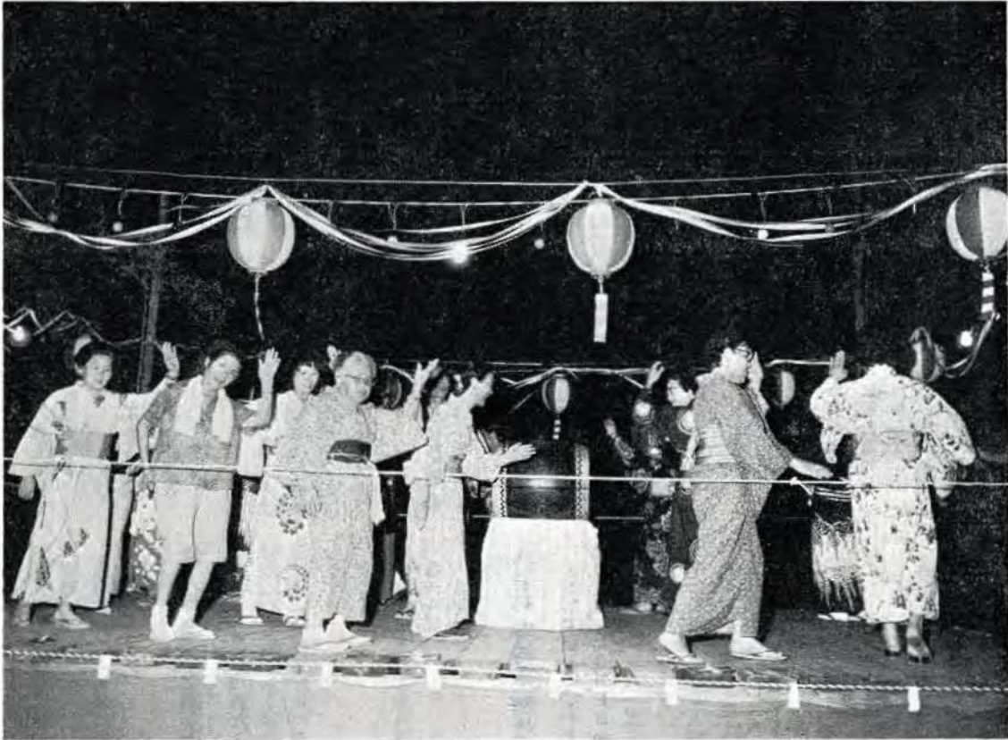
楽しく踊るお年寄りのみなさん