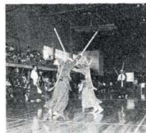
熱戦が繰ひろげられた剣道と柔道会場