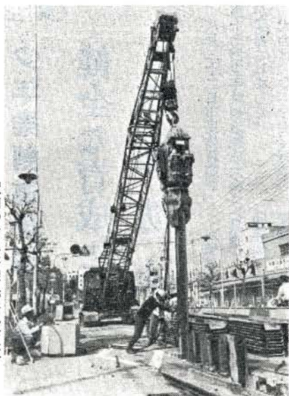
駅前汚水幹線管布設工事