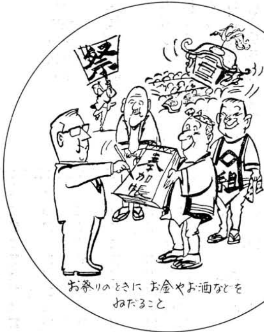
お祭りのときに お金やお酒などを ねだること