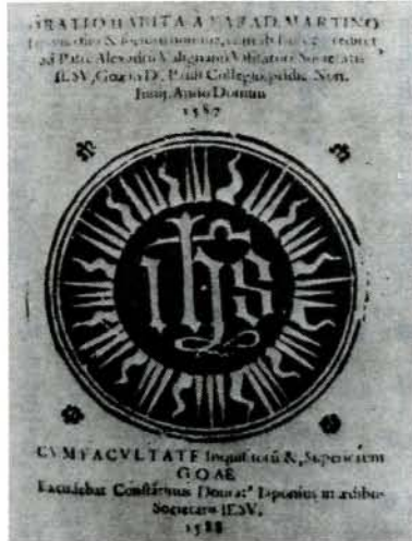
ゴアで印刷された原マルチノ演説表紙

アフリカのモザンビク地方からインドに向けて風が吹くのは、年の内に三月と八月の時期だけでした。結局、使節達は、ここで翌年の三月までの間、約半年間風待ちしなければなりません。また不幸は続くもので、リスボンからこの