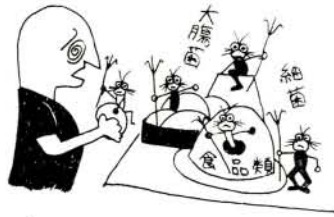
食中毒に気をつけよう