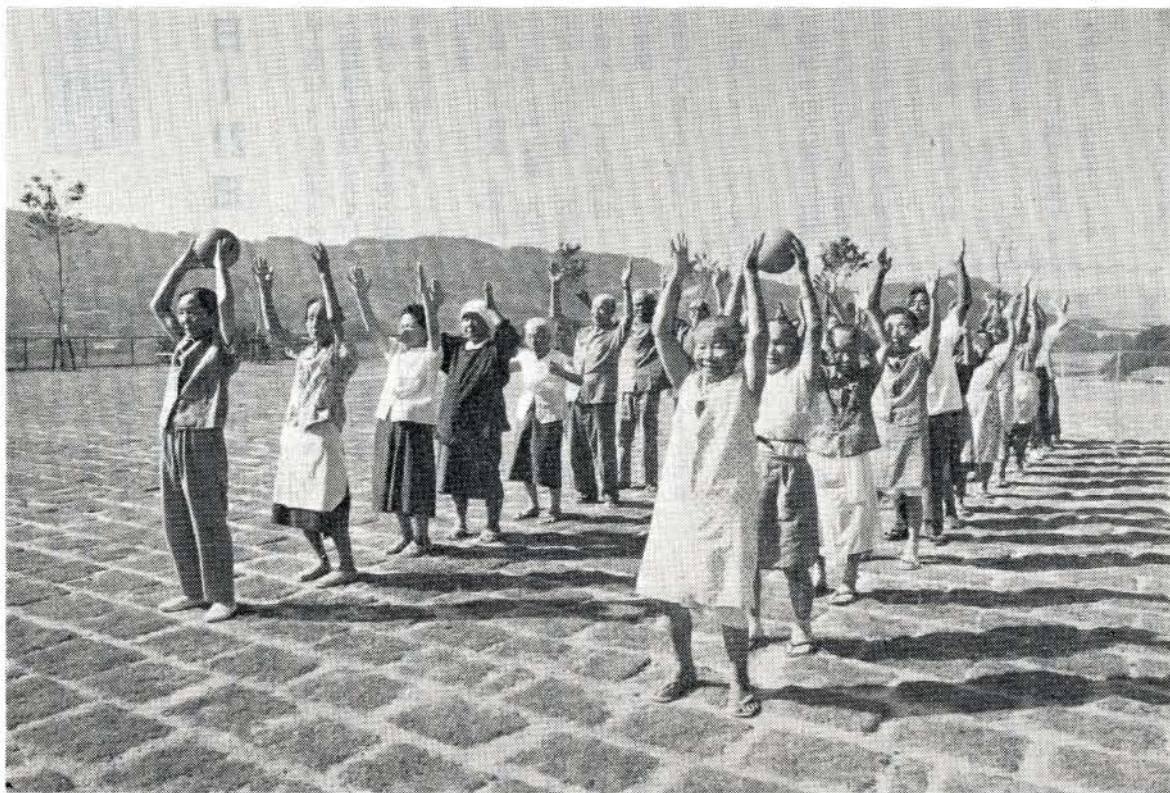
レクリエーションを楽しむ清和園の皆さん