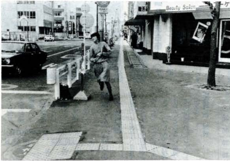
バスターミナル～水田町まで盲人用誘導点字ブロック

中地区住民センター、萱瀬 出張所の入口を車いすでも入 れるようにスロープ工事を行 いました。