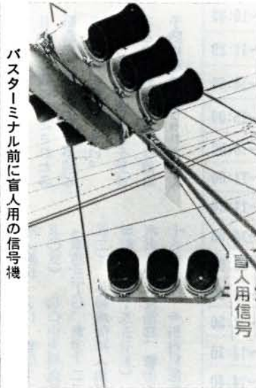
バスターミナル前に盲人用の信号機