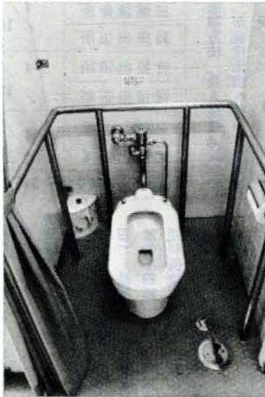
出張所の便所を身障者用に改造