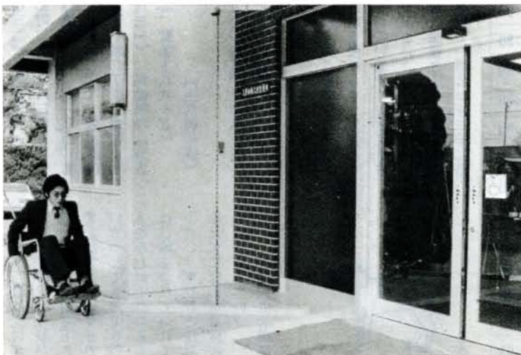
出張所の入口を自動ドア、スロープ化