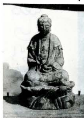
東光寺の銅造薬師如来坐像▼