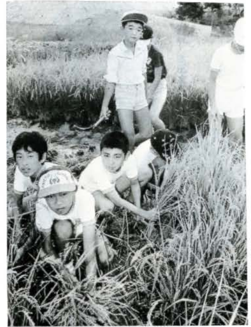
▲ 稲刈りって難かしかネ (10/15 旭が丘小)

6月に植えたモチ米がすくすくと成長し6年生全員で稲刈りをしました。収穫は約150kg。冬休み前に、モチつきをしたりして味を楽しみます。