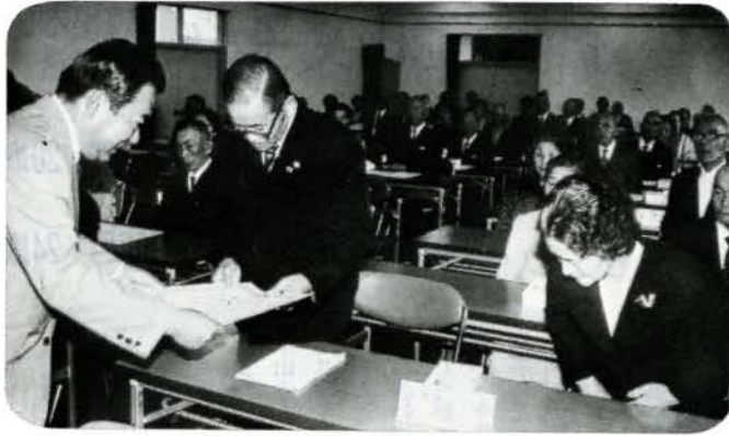
▲ “共に歩んで50年” 金婚祝賀状贈呈式 (10/12 福祉センター)

今年は44組の金婚カップルに、祝賀状と記念品が贈られました。「これからの人生は、夫婦で元気に過ごし、少しでも社会の為に尽くしたい」と代表者が謝辞を述べました。