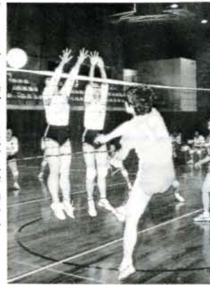
バレーボール決勝戦 (富の原一丁目～協和町)