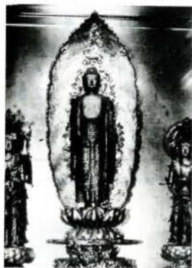
▲長安寺の木造阿弥陀如来立像

10月7日、市文化財保護条例に基づき有形文化財として3件、史跡として2件を指定しました。これで市内の文化前が慶長14年(一六〇九年)