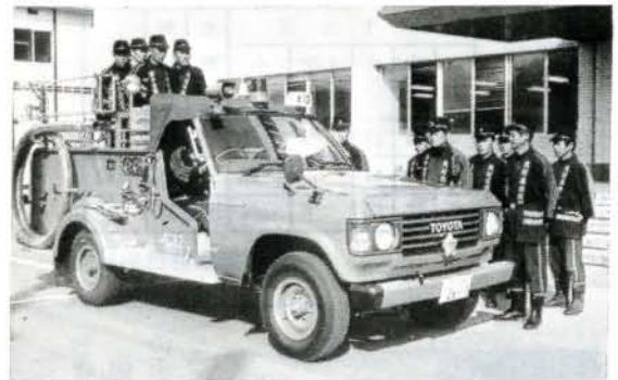
▲ さらに備えは万全になりました (10/14 市役所)

大村市消防団第10分団(荒瀬、原、宮代地区)に新しい消防ポンプ自動車が引渡されました。団員の皆さんは、さつそく機械操作の訓練に励んでいました。