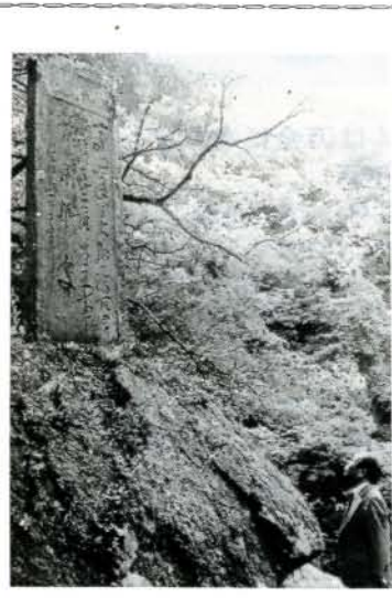
(大村警察署防犯課)

ここに集合し、戌辰の役の出兵計画など事ごまかに打合せされた、といわれる。明治維新後、会計検査院長となつた渡辺昇は倒幕運動の主だった37士の血盟の場所として碑を建立、自ら筆をとつて「王事に斃れん事を誓いし處」と刻んでいる。