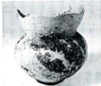
小壺 古墳時代(約千五百年前頃)