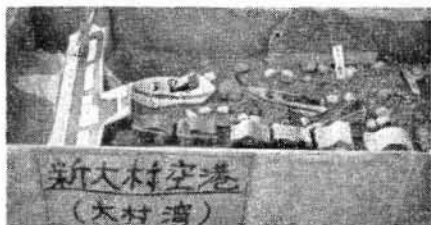
小学生の作品「新空港」