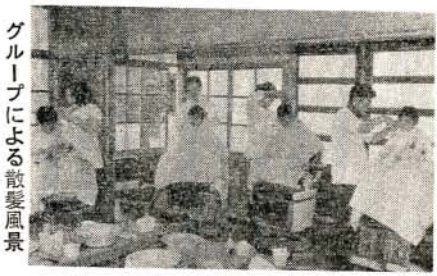
グループによる散髪風景