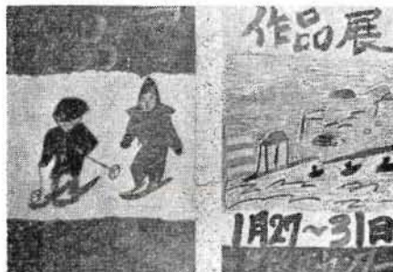
中学生の作品「ポスター」