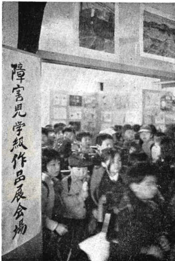
大勢つめかけた子供たち

2月25日(火) 市役所市民相談室 10時～15時 なるべく事故に関係の 書類をご持参下さい