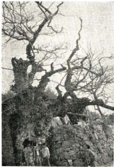
三浦日泊のムクノキ