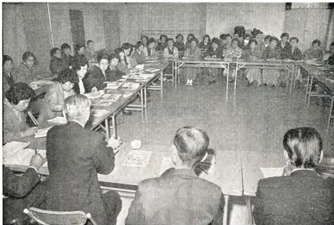
活発な意見を出す生活学校のみなさん