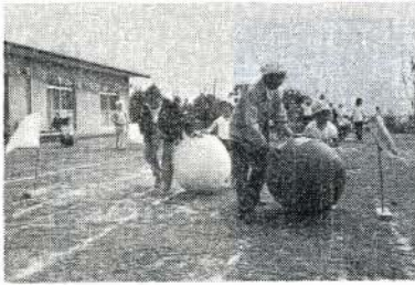
園児と力を合せて

競技は、特別につくったコースで開始し、盛り沢山のプログラムの中で、玉ころがしなど園児と力を合せての演技