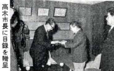
高木市長に目録を贈呈