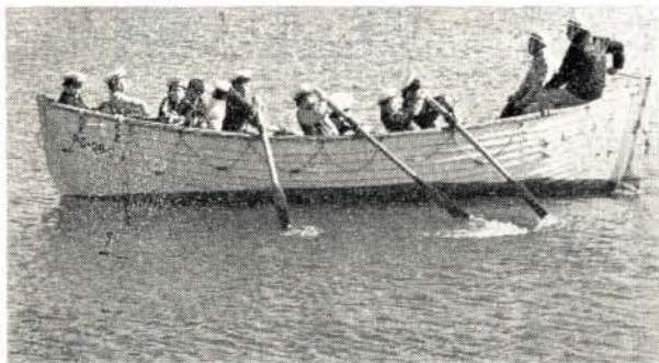
元気いっぱい漕艇訓練する団員たち