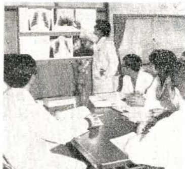
専門スタッフによる病歴検討会