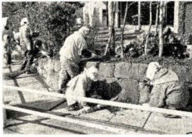
清掃奉仕に汗を流す老人会の皆さん

市内の小・中学校の児童・生徒を対象に、大村市明るく選挙習字コンクールの作品募集を実施しましたところ小学校二千三十六点、中学校二百