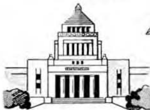
議員定数の決定 選挙区の決定