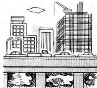
過密・過疎対策、地域計画