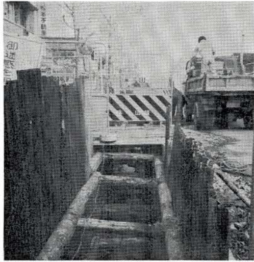
駅通りの管布設工事