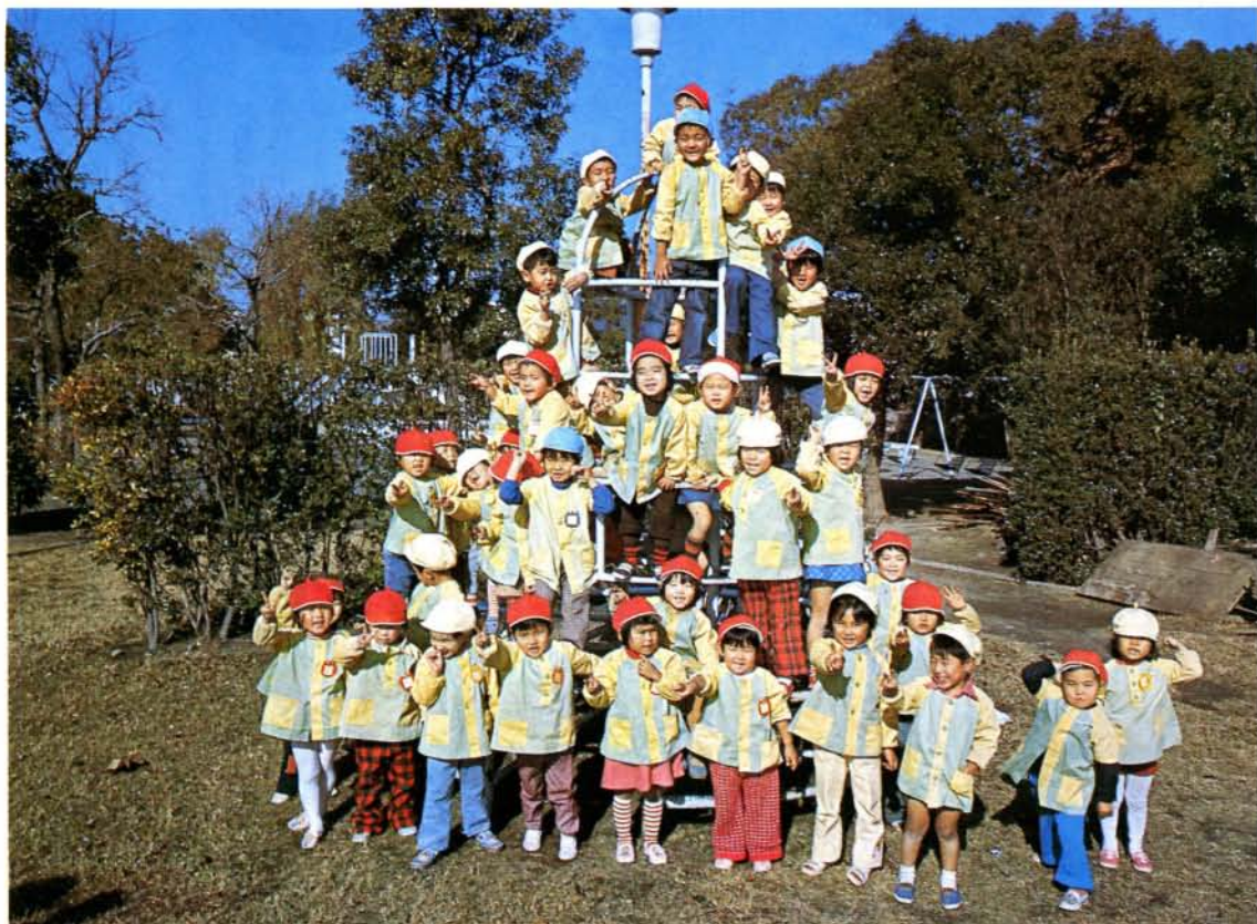
明日をきづく子どもたち (本町保育所の園児たち)