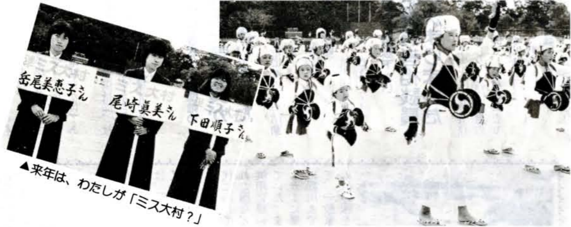
▲来年は、わたしが「ミス大村？」