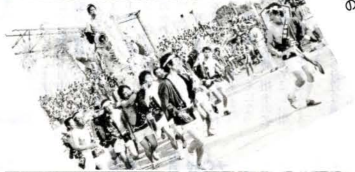
◀10月14日(祝)の夜に 行われた「おむら」