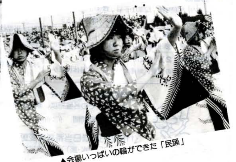
▲会場いっぱいの輪ができた「民踊」