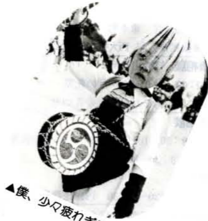
▲僕、少々疲れきみて〜す