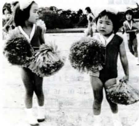
▲わたしも頑張ったのよ「子どもバントラワース」