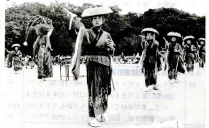
▶優雅な踊り「沖田踊り」