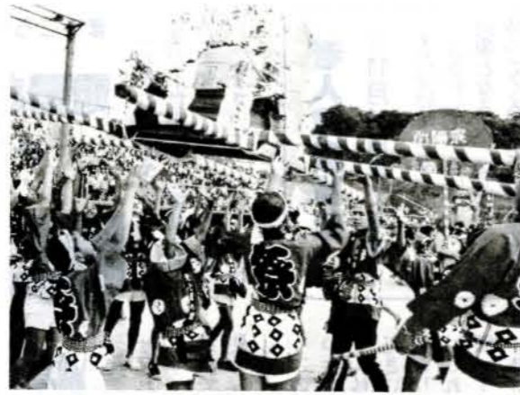
◀天まで届け子ども「樽みこし」

人権を無視されている人、土地・金銭貸借・相続などでお悩みの人は、お気軽にご相談下さい。費用は無料で秘密は守られます。