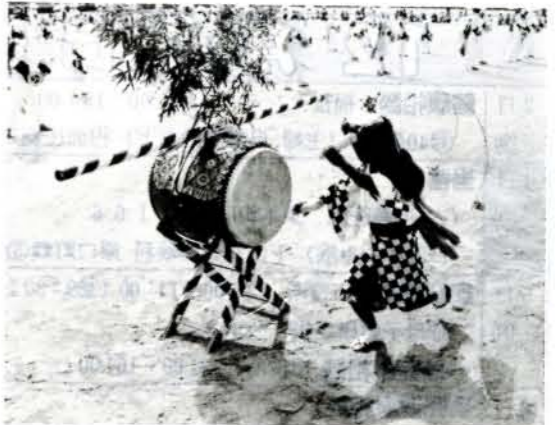
▶ハチさばきもめめめめ 「今富祭り」