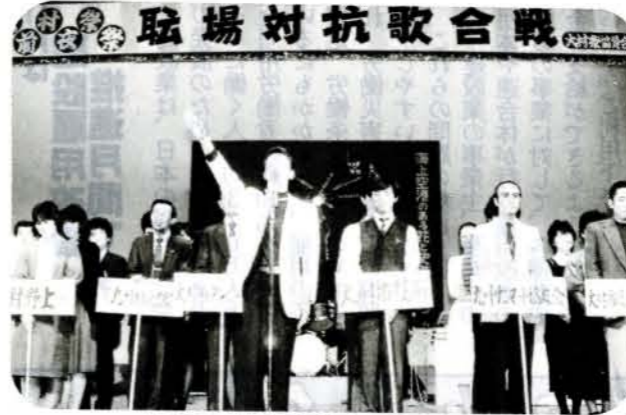
▲前夜祭「職場対抗歌合戦」