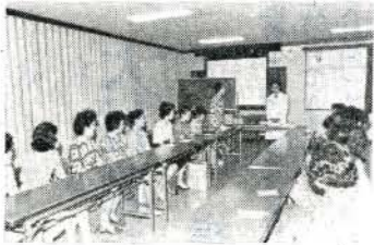
尾崎院長から話を聞く婦人会のみなさん

設備は、八本の柱に四十八個の水銀燈が取り付けられ、一個千ワットの明るさがあり、工費は、千二百万円でした。