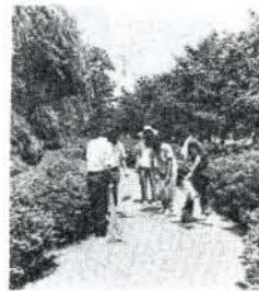
富ノ原松下工業親睦会の皆さんで大村公園を清掃